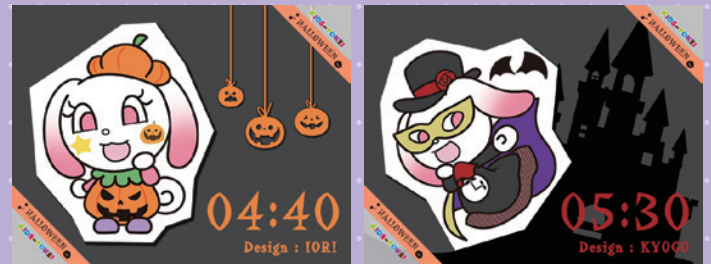
HALLOWEEN KIDS-TOKEIのグランプリ作品 (Design : IORI, KYOGO)

グランプリに選ばれた作品を着たとけいちゃんが KIDS-TOKEI CHRISTMAS 2015 公開ページに登場するよ!